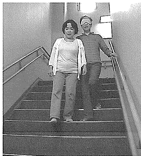
ガイドヘルプ体験