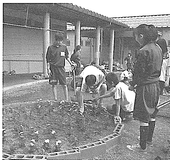
植え方は生徒のアイデアで

大町市総合福祉センターには、保健委員会の生徒30人が訪れ、中庭の草とりや花壇にマリーゴールド・日々草・サルビアなどの花の苗を植えていただきました。