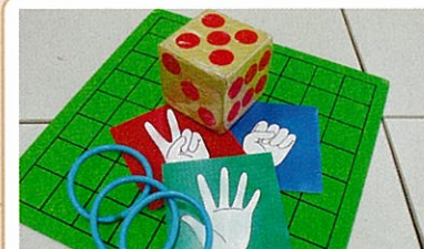
手作りゲーム用品 多数