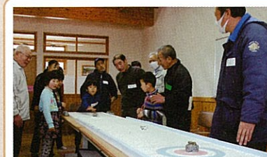
卓上カーリング 『カーレット』