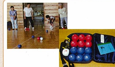
『ポッチャ』セット パラリンピック正式種目