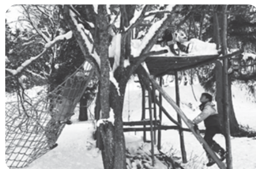
1月16日 森のオープンデイ