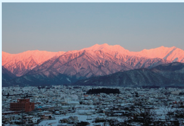
2022北アルプス 新春の朝焼け

コロナ禍で地域のつながりが切れてしまわないように、気持ちが落ち込んだりしないように、地元の心を動かす風景写真でつながってみませんか。