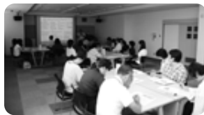
8/25 防災訓練（職員研修会）