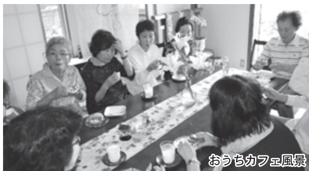
おうちカフェ風景