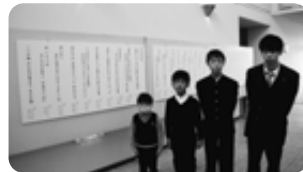
大町市社会福祉大会 （福祉啓発標語入選者表彰）