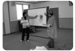
こどもと大人の食堂「パネルシアター」