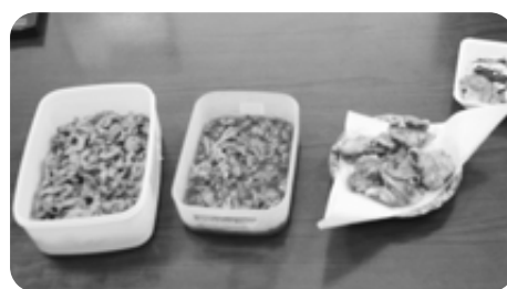
お惣菜も販売しています。