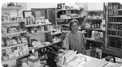
商店もやっています。