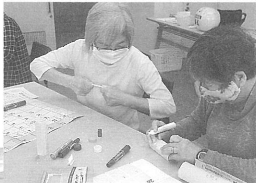
ゲームを体験して...

レクリエーションは、介護予防やコミュニケーションをとるきっかけになっています。今回は、ゲームの組み立て方やアレンジ力をつけるために少人数での「ミニレク講座」を開催しました。参加者は、地域で活動されている方や福祉施設に勤務されている方などさまざま。講座は、8月7日(金)・10月2日(金)・12月4日(金)の3回で行い、テーマは「遊び方を体験しよう」で、昔のゲームなどを体験した後アレンジの方法を教えるという学びました。3回の講座を通して、「みんなどんなふうにならなくていいかな?」「手近な物で作れないかな?」「みんなで作って遊ぶのもいいね!」皆さん「チャレンジ」という