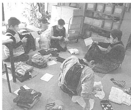
子ども服の仕分け作業

12月7日(月)大町市老人クラブ女性部の18人が、社協にボランティアに来ていただきました。作業は、グループに分かれ、寄付された着物10枚をほどこたり、コアラのぽけににいたいた冬用子ども服を、サイズ別に仕分けしていただきました。2時間ほどでしたが皆さん手際よく作業していただき、予定していたものをきれいに片付けていただきました。