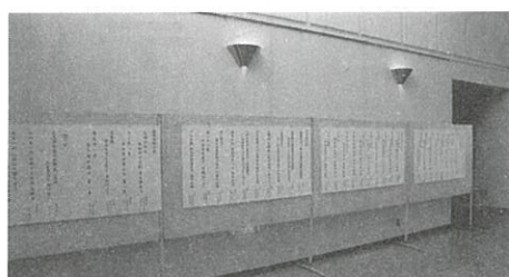
社会福祉大会で発表

日時 12月14日(月) 午後1時30分～3時30分 会場 市総合福祉センター 3階 休養娯楽室 内容 講演 「つながりが築く！ 生き生き・元気な暮らしづくり」