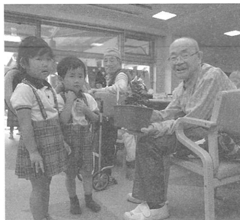
きれいなお花 ありがとう