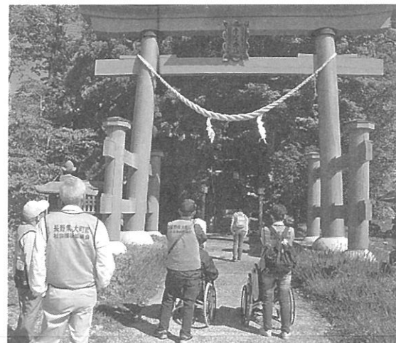
H29 ボラと一緒には希望の旅へ