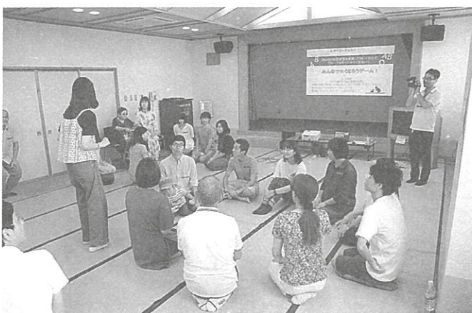
長生とゲームで交流