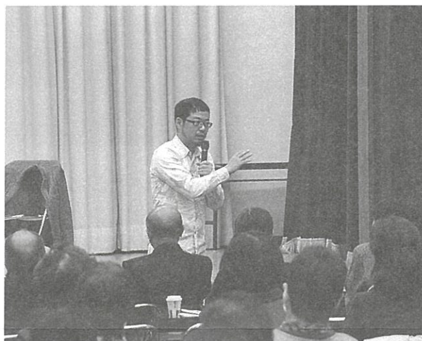
平成28年度社会福祉大会

これからの地域福祉を考える機会とするために、「大町市社会福祉大会」を開催します。今回のテーマは「想像力と創造力」。今年日本各地で発生している自然災害、私たちが暮らす大町市でもいつ災害に見舞われ、被災するかわからない状況です。もし自分が被災者になったら...どうなるかを「想像」し、そのために必要なものや活動を個人や地域で「創造」していくきっかけづくりとなる。