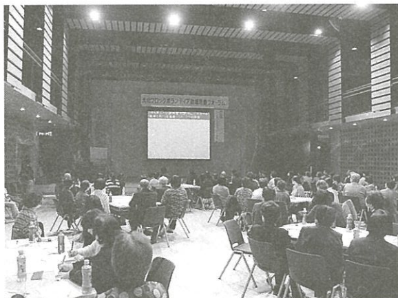
地域活動フォーラムすず音ホール

マを設け、意見交換を行いました。より多くの参加者との情報交換ができるようにと、テーマにつき20分間話し合い、次のテーマに移動するワールドカフェ形式で行いました。大学生や池田工業高校のボランティア部の生徒との意見交換は、初めての試みでしたが、参加したボランティアは学生たちが勉強以外に、さまざまなボランティア活動をしていることに驚いていました。また学生は、継続してボランティア活動を行っていることに感心し、気付くこともたくさんあったとの感想がありました。フォーラムは、大変盛り上がり、会場は熱気にあふれていました。