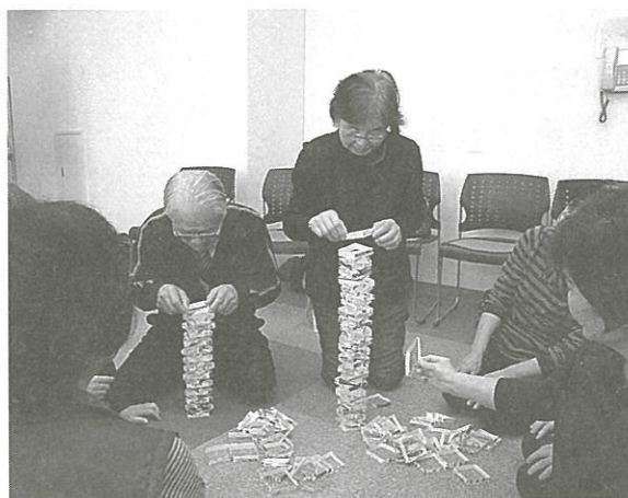
平成28年度リーダー研修会