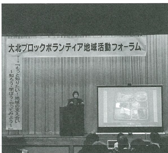
昨年度の様子(小谷村)

大北地域で活動しているボランティアが集まって、研究協議や情報交換を行う「大北ブロックボランティア地域活動フォーラム」が、大町市で開催されます。 今回は、「今、求められるボランティア活動」をテーマに、講演とグループワーク(少人数でテーマに沿った話し合いをします)を行います。グループワークのテーマは、「地域の課題と求められるボランティア活動」です。