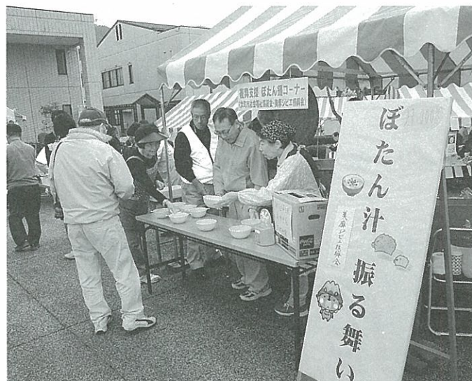
大盛況！ぼたん鍋振る舞いコーナー

10月10日の市民ふれあい広場で、大町市社協復興支援イベントとして、「美麻ジビエ振興会のぼたん鍋」とやきとり、の振る舞い、東日本大震災被災地と神城断層地震被災地（美麻白馬・小谷）の特産品の販売を行いました。どちらのコーナーも大勢の皆さんに来ていただき、大盛況でした。また、両コーナーに義援金箱を置き、ご協力をお願いしたところ、美麻復興支援義援金4450円、台風18号等大雨災害義援金1508円、東日本大震災義援金19160円のご協力をいただきました。この義援金は、各被災地の復興に役立てていただくよう送金します。ありがとうございました。