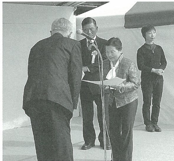
代表して大町病院内ボランティア