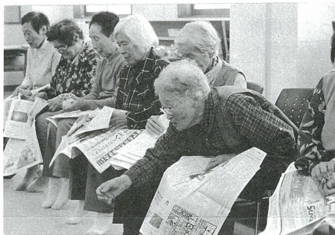
ふれあいいきいきサロン「毒〜会」