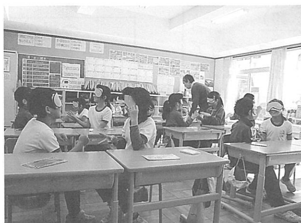
南小3年生アイマス体験

昨年度の福祉教育の報告をします。市内小学校6校で17回、中学校1校で3回、高校で2回と、いろいろな福祉体験を行いました。体験内容は、点字・手話・車いす・アイマス・ガイドヘルプ・ボッチャ・高齢者疑似体験や障がいのある方との交流会も行いました。福祉体験については、事前に内容など打ち合わせをしてから実施しています。体験をした児童や生徒からは、見ていて様子はわかっていても、実際に体験することになった時の不便さや気持ちの変化があったとの感想をたくさんいただきました。 今、誰もが安心して住み慣れた所で暮らし続けられるような、地域づくりが求められています。そのためにはお互いを知ることが大切になります。いろいろな疑似体験は、相手の気持ちをわかりあえる手段の一つです。