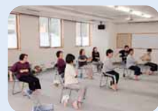
イスを使ったチェアエクササイズ