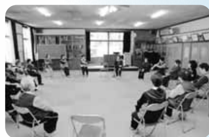
上一ネットワーク