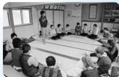
六九町やまぼうしの会