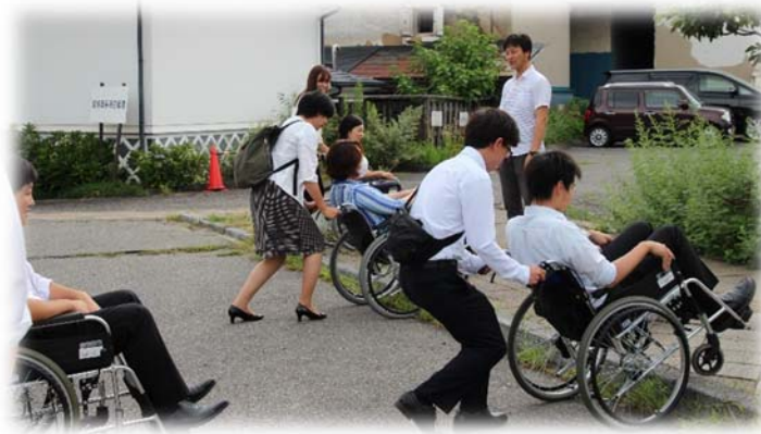
大町青年会議所福祉体験 (H29.8.19 大町市総合福祉センター周辺)