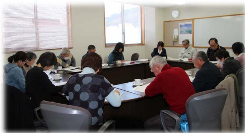
ボランティアセンター運営委員会（H30.2.23 大町市総合福祉センター）