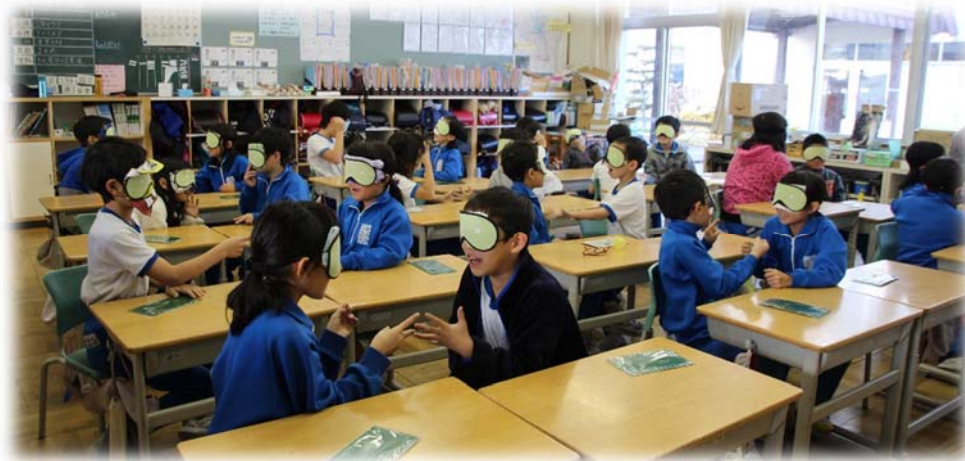
アイマスク体験（H29.12.7 大町南小学校）