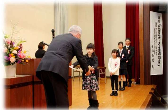
社会福祉大会福祉啓発標語最優秀賞受賞者表彰（H30.2.3 サン・アルプス大町）