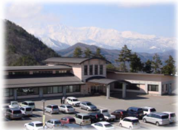
美麻総合福祉センター