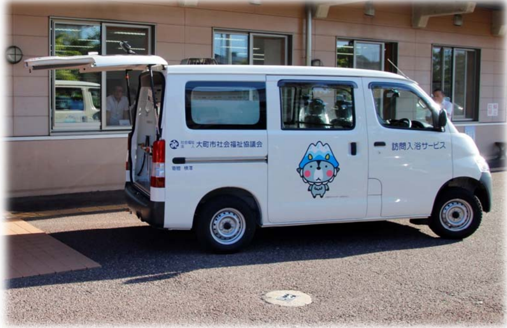
訪問入浴車「大町にここ」