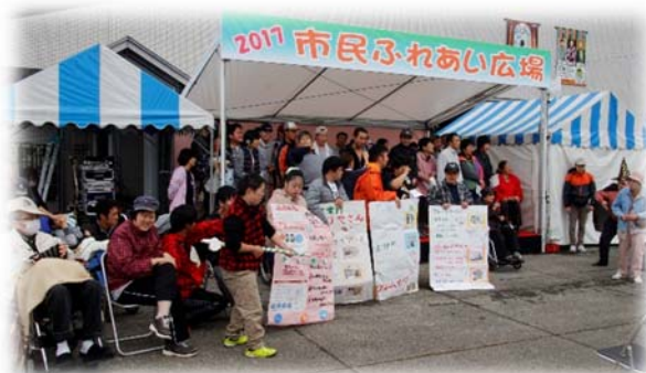
ふれあいステージ（H29.10.7 大町市文化会館前広場）