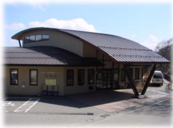
八坂総合福祉センター