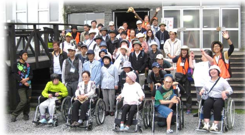
日帰り旅行（H29.7.7 ハケ岳ロープウェイ）