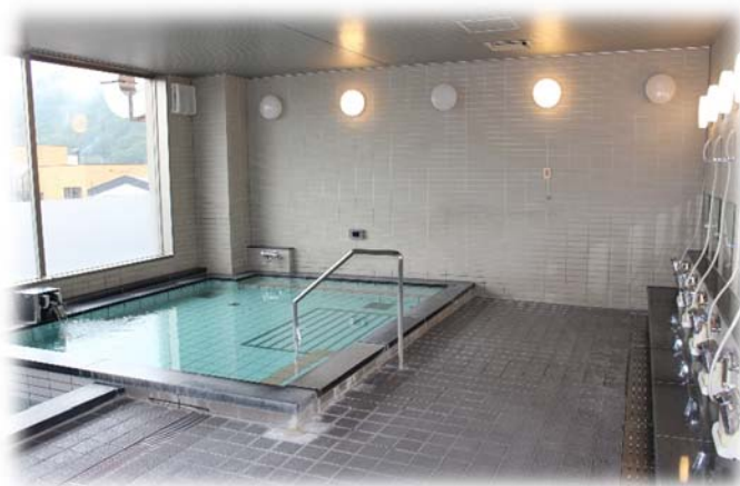
大町市総合福祉センター3階公衆浴場の展望風呂