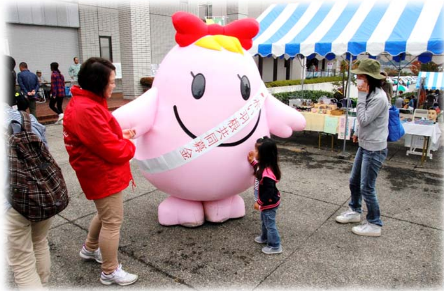
共同募金会シンボルキャラクター「愛ちゃん」 (H29.10.7 大町市文化会館前広場)