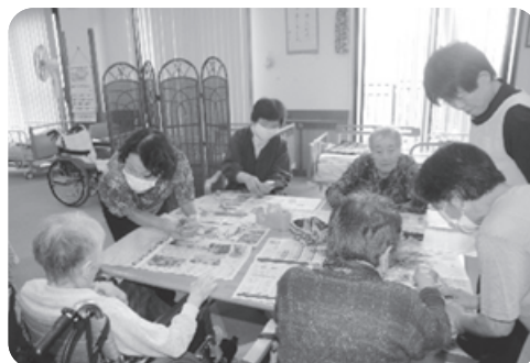
デイみさか ボランティア交流 「ラベンダーのミニブーケづくり」