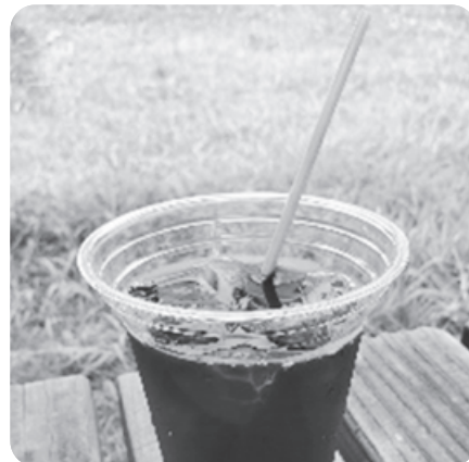
障がい福祉サービス事業所 「ライ麦ストロー」の販売