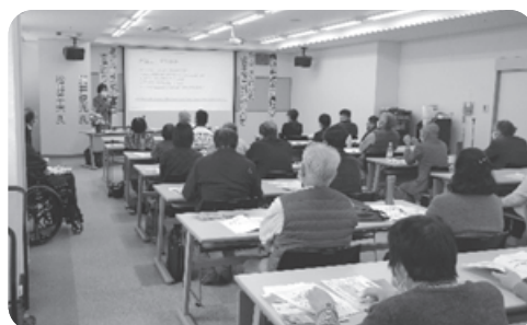
北アルプス後見支援センター 手をつなぐ育成会研修会