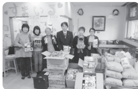
フードドライブ 商工会議所女性部