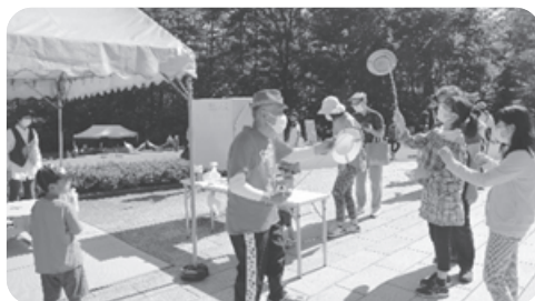
北アルプスフェアで活躍する賛助会メンバー