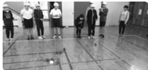
北小6年生がボッチャの体験をしました