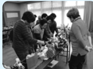
「小地域福祉ネットワーク」