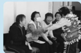
ファッションショー。皆さんにお披露目です。