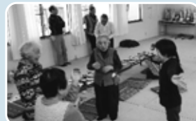
脳トレ体操したり