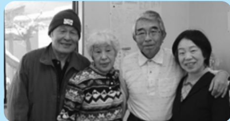
発起人のみなさん ※写真左から

決まっているのは、開催日時と参加費100円のみ。会員制もなく、西山住宅住民なら子どもからお年寄りまで誰でも参加できる。