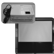
DVD内蔵プロジェクターほか