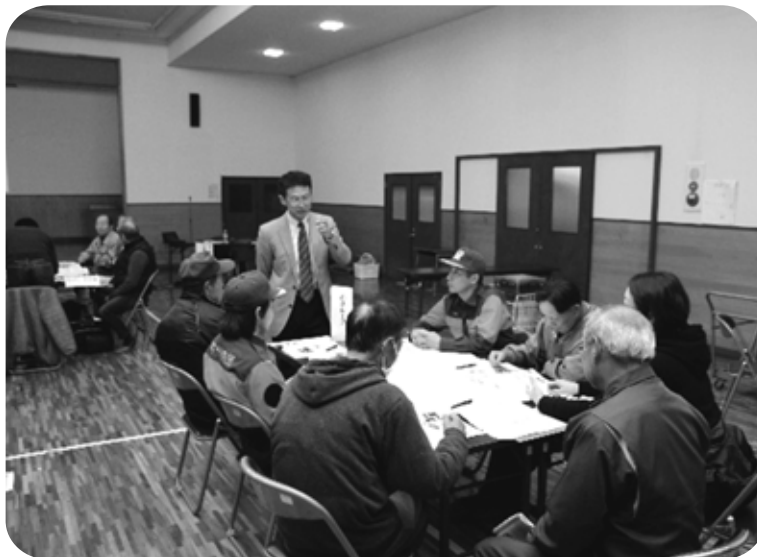
〈社地区で開催された「災害時連携研修会」の様子〉