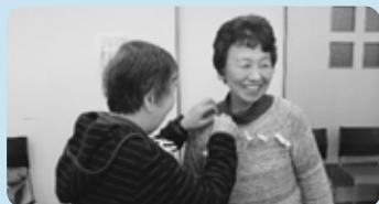
負けたら、自分の洗濯ばさみを相手に付けて…