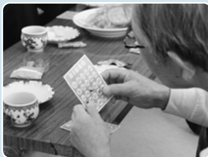
まずは、皆さんでお茶を飲みながら「ビンゴ大会」