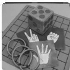
手作りゲーム各種