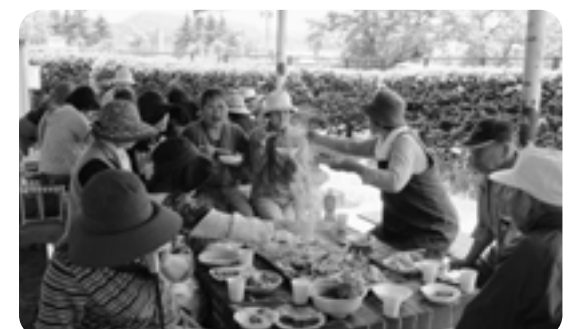
春のお楽しみ会ではバーベキューをしました。天気も良く、笑顔いっぱいのお楽しみ会でした。

地域の集いでは、たくさんの笑顔が生まれていました。 あなたの地域では、どんな笑顔が生まれていますか。