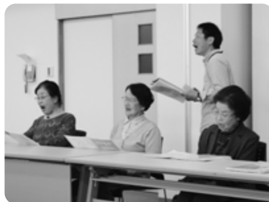
難しいことをするわけではありません。みんなで楽しく歌って仲間づくり。

今、地域では地域の「課題」として、少子高齢化、要介護者の増加、地域関係の疎遠化などが挙げられています。