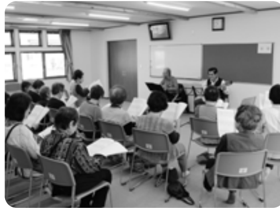
町内に住むマンドリン奏者を招き、演奏に合わせて、みんなで歌いました。