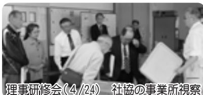
理事研修会(4/24) 社協の事業所視察