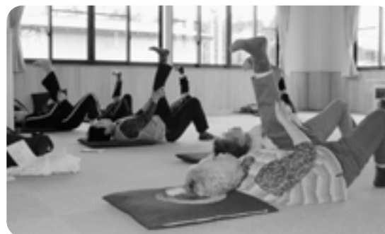
体操の内容は、ストレッチ・筋トレ・歌に合わせた体操。年1回は、課外教室として、親睦旅行へ。