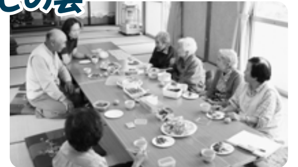
一の瀬地区集会所で開催した一場面。みなでお茶を飲んで楽しくお話をする会です。