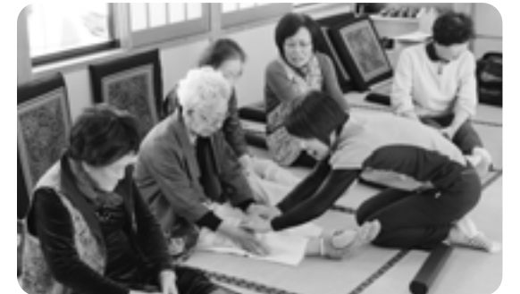
出席回数に応じて、メダルを贈呈。皆勤された人には、金メダル。無理なく楽しく続けることが大切。