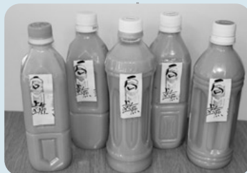
EMプリン石鹸 一つ110円です

EM菌が環境によいと聞き、知人の紹介がきっかけで購入。台所、風呂場、洗面所と家中置いて、手洗いや食器洗い等に使っている。蛇口などの金属部の汚れがよく落ちる。化合物もなく安心して使える。