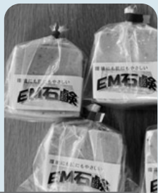
EM固形石鹸 一つ110円です

石鹸の材料になる使用済み油を提供したことがきっかけで購入。お好み焼き屋なので、ソースや油で汚れた鉄板を洗浄するのにEM固形石鹸が大活躍。作業着などの油染みにも使用。泡切れもよくすすぎに使う水の量も節約。手にもやさしくこれからも販売を続けてほしい。