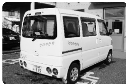
移送車両「さわやか号」