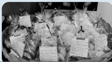
手作りクッキー 一つ100円です

作業所を応援する気持ちで購入したのがきっかけで、今ではファンになった。コーヒーを飲むときの茶菓子として小袋に入っていてちょうどいい大きさのクッキーが大好き。家族のお土産としても購入している。