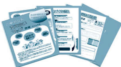
支え合いマップ 作成マニュアル