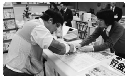
企業での福祉教育 (JA大北平支所 高齢者疑似体験)