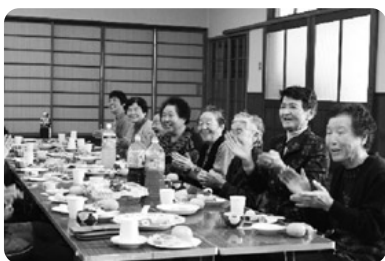
小地域福祉ネットワーク活動の様子