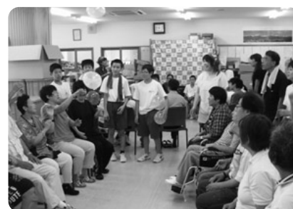
大町第一中学校 体験学習受入（ひまわり）