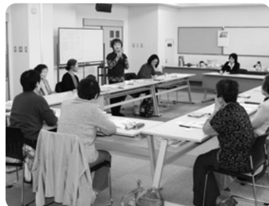
ボランティア団体情報交換会の様子