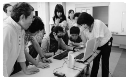
小中学生ボランティア塾 (視覚障がい体験 音声パソコン)