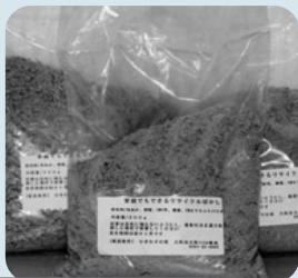
ぼかし 一つ110円です

5年前より購入している。生ごみを畑の肥料にできるぼかしは環境にもいい。できた液肥は祖母も鉢植えなどに使用。とてもよく育ちうちでは必需品となっている。