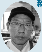
名店街 はっちゃん

石鹸の材料になる使用済み油を提供したことがきっかけで購入。お好み焼き屋なので、ソースや油で汚れた鉄板を洗浄するのにEM固形石鹸が大活躍。作業着などの油染みにも使用。泡切れもよくすすぎに使う水の量も節約。手にもやさしくこれからも販売を続けてほしい。